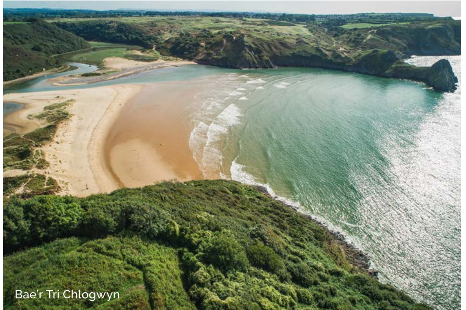
Bae'r Tri Chlogwyn