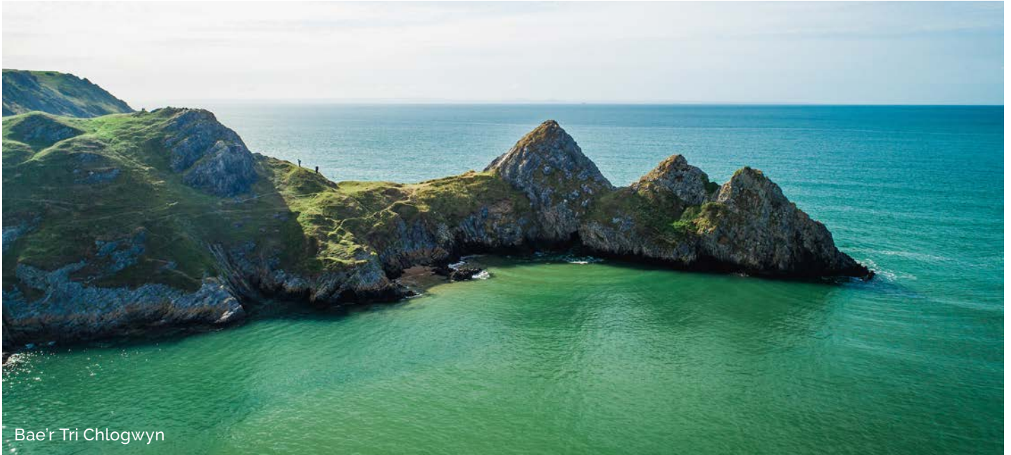
Bae'r Tri Chlogwyn