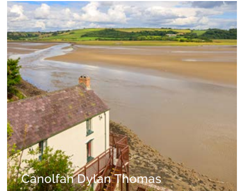
Canolfan Dylan Thomas